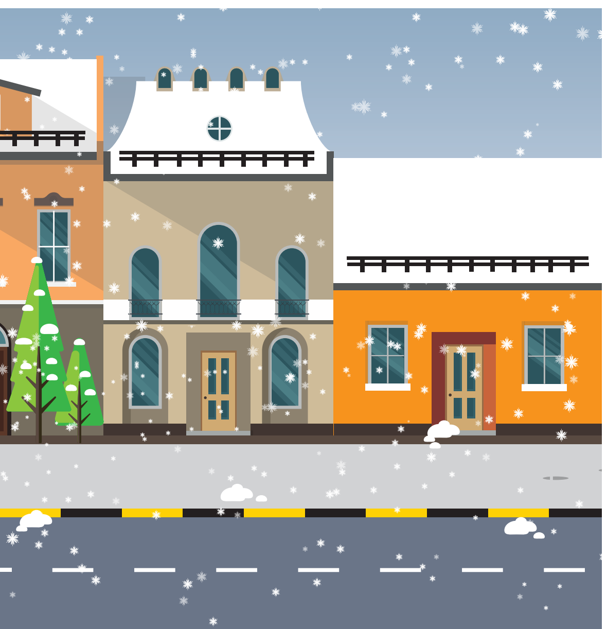
Riskin pienentäminen - todennäköisyyttä vähentämällä