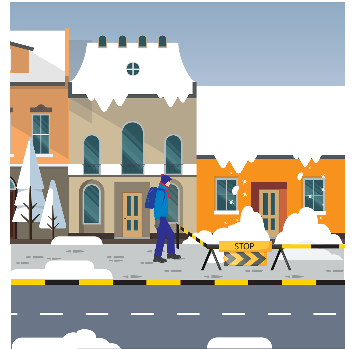
Riskin poistaminen - seuraus poistamalla