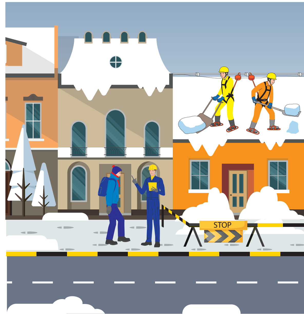
Riskin poistaminen - todennäköisyys poistamalla