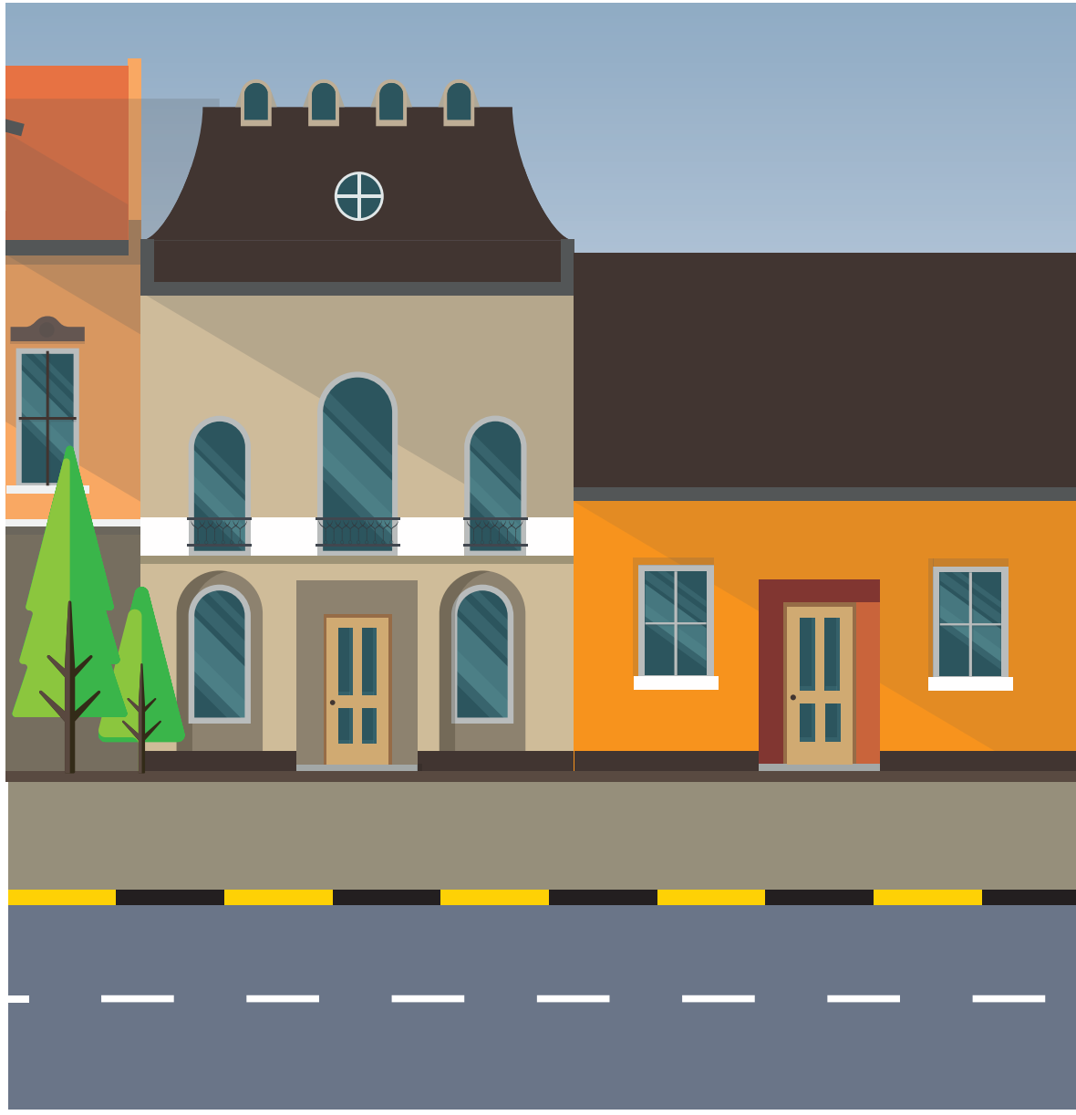
Vaaran paikan tunnistus