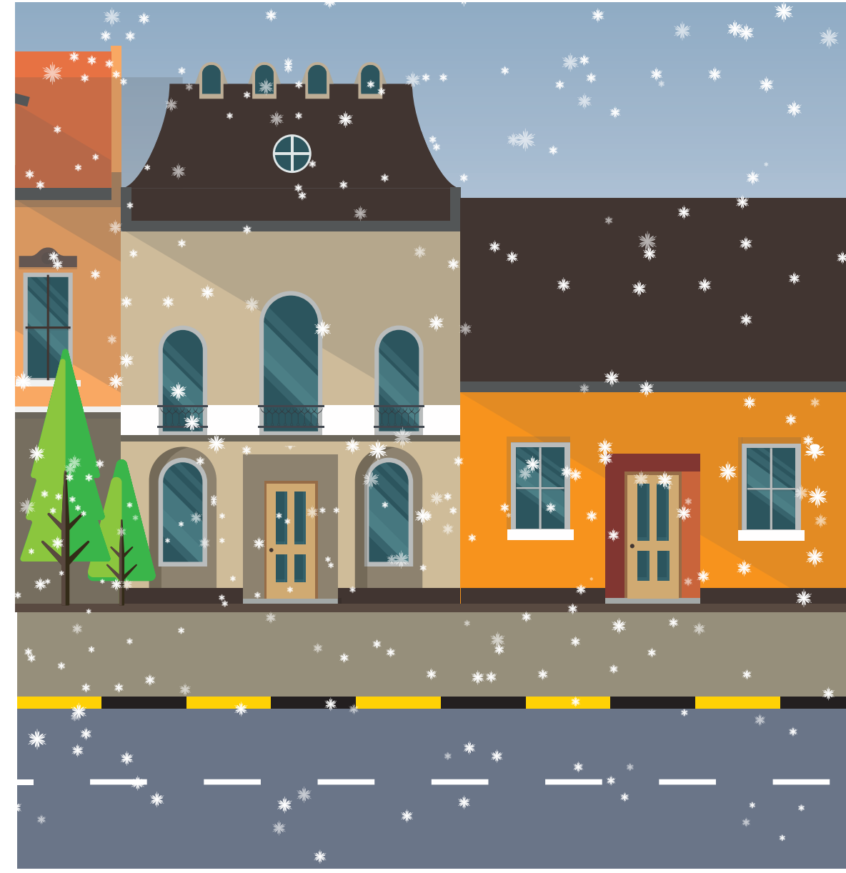
Vaaran kehittymisen tunnistus