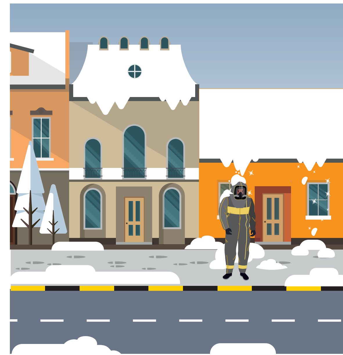
Riskin pienentäminen - seurausta pienentämällä