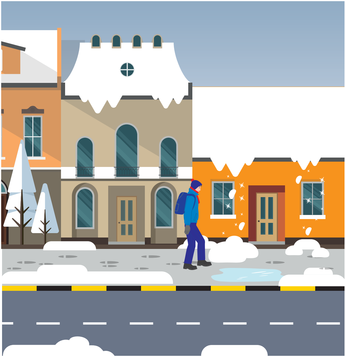
Läheltä piti -tilanne